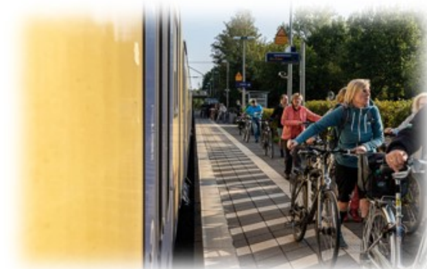
Stundentakt aus Hannover und Hamburg / Lüneburg