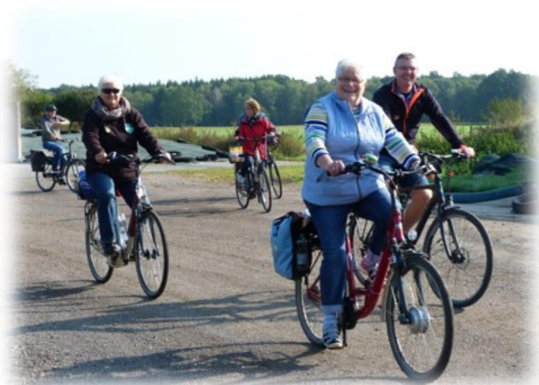
Eine Runde für Alle und jeden