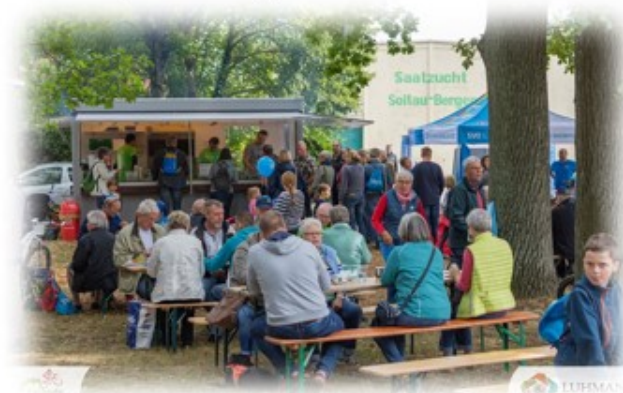
Bequeme Anreise mit dem Metronom im