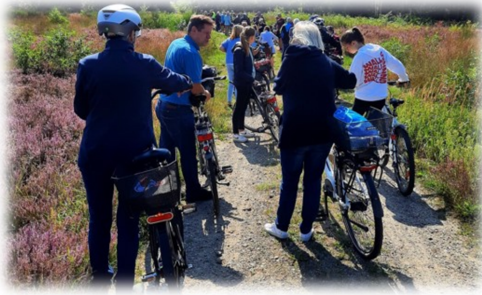
Tolle Landschaft im Naturpark um Eschede