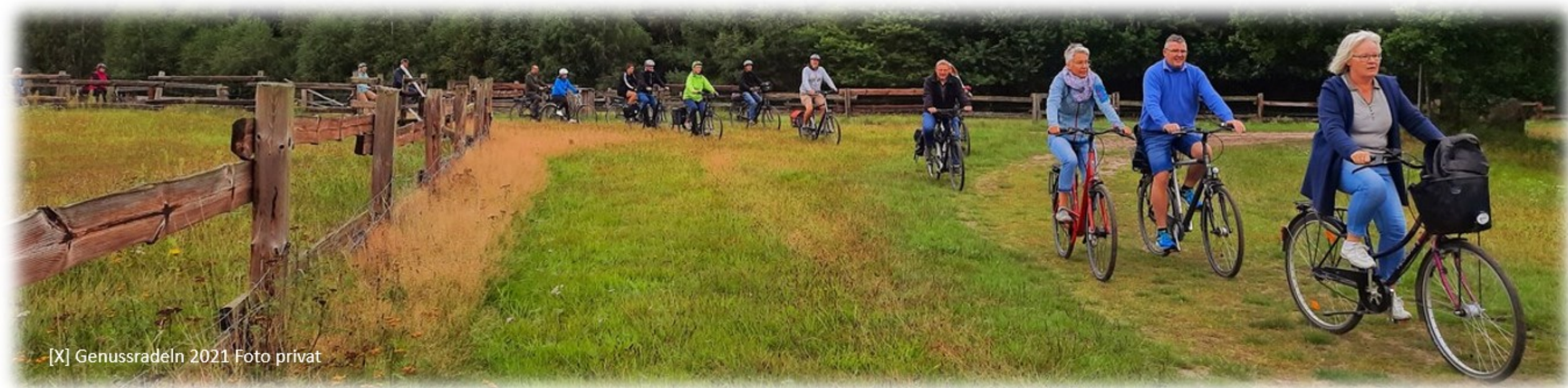
[X] Genussradeln 2021