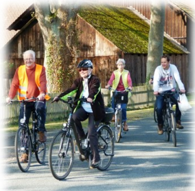
Tour durch gemütliche Heidedörfer