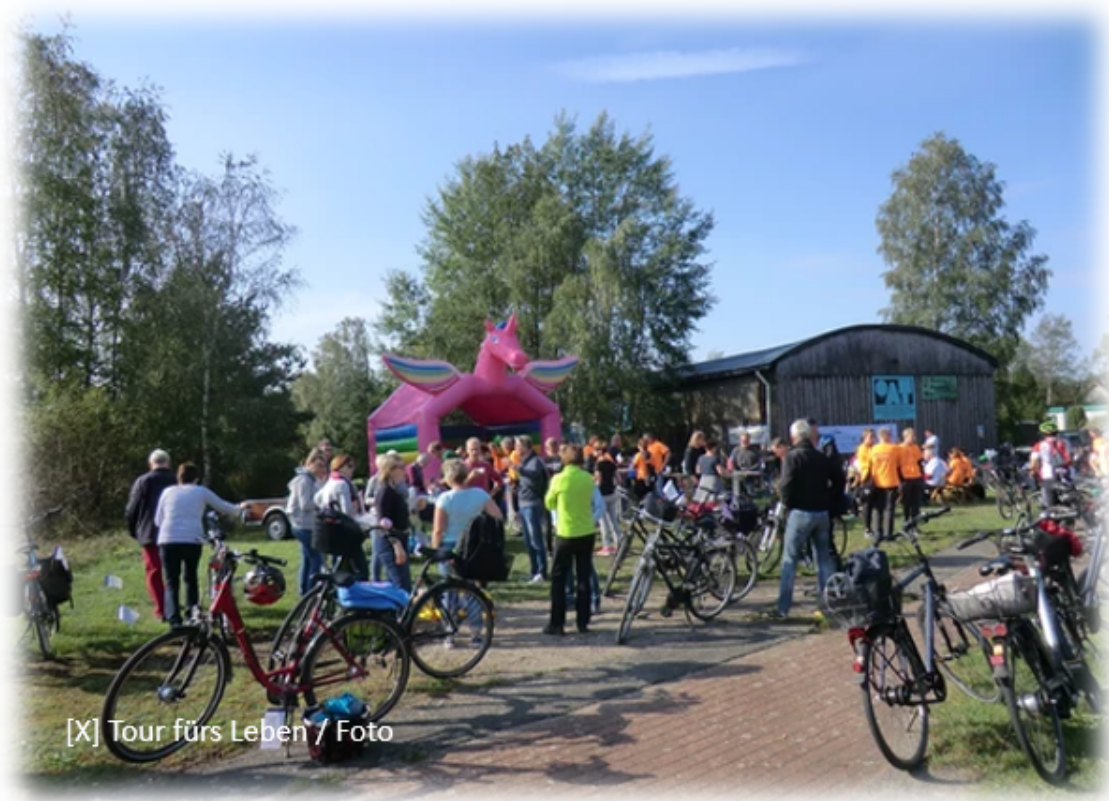
[X] Tour fürs Leben / Foto

"Tour fürs Leben" und "Eschede erfahren" werden zu "Beweg dich"