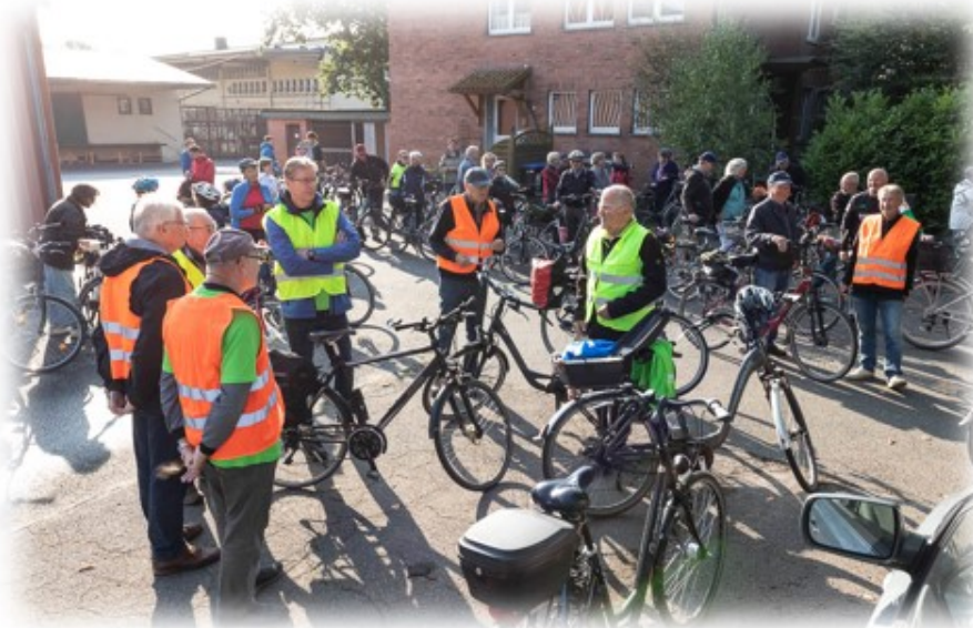
Erfahrene Begleiter auf der Strecke